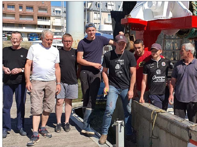
Pour l'équipage de la "P'tite Manu" : "La zone qui nous sera interdite est immense, en plein dans nos territoires habituels tant pour la pêche à la drague que pour la pêche au chalut".