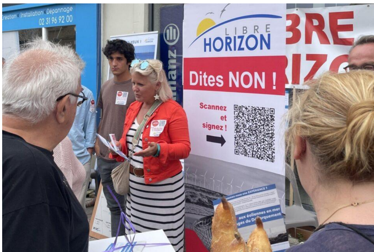
Libre Horizon souhaite voir fusionner les projets de Centre Manche 1 et 2 avec le projet de parc éolien de Courseulles

L'association Libre Horizon qui lutte contre le projet de parc éolien, était sur le marché de Courseulles ce vendredi 11 août 2023 pour informer et sensibiliser.